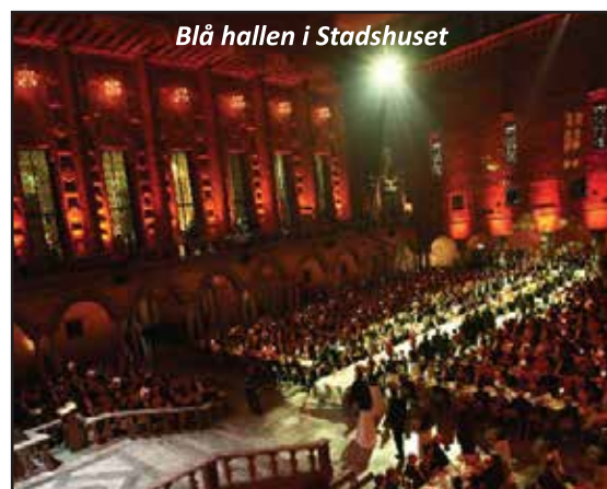
Blå hallen i Stadshuset

Biljetter till galan kostar 200 kr för medlemmar och 400 kr för icke medlemmar och beställs via Biljettelefon 08- 508 86 601 (tala in namn, telefonnummer och hur många biljetter) eller e-posta till sos@fub.se .