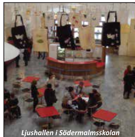
Ljushallen i Södermalmsskolan