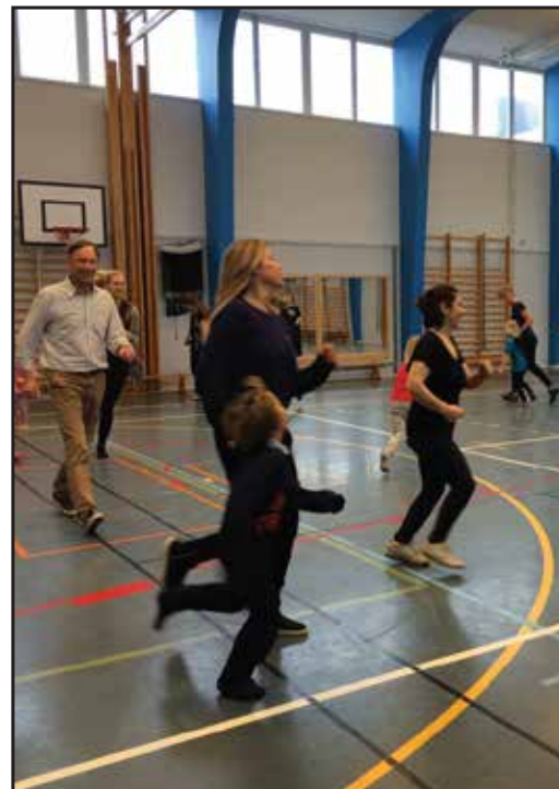
Full fart i FUB Stockholms barngympa!

Vi kan också konstatera att det skett en ökning av antalet deltagare i samtliga fritidsaktiviteter denna höst, vilket är mycket glädjande. Samtidigt är det ett kvitto på att våra ledare gör ett fantastiskt jobb. Varje vecka!