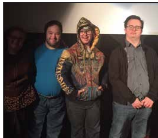
Mosaikteaterns skådespelare var med på seminariet 9 oktober

Seminarie serien arrangeras av SV i samverkan med FUB Stockholm och Svenska Downföreningen. Anmälan görs via SV's hemsida www.sv.se/stockholm eller via 08-679 03 30.