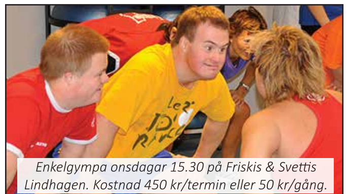
Enkelgympa onsdagar 15.30 på Friskis & Sveltis Lindhagen. Kostnad 450 kr/termin eller 50 kr/gång.

Du kan också ta del av Stockholms stads fritidstips för vuxna via deras hemsida www.stockholm.se/gruppbostadfritid . Sidan uppdateras med nya tips varje måndag.