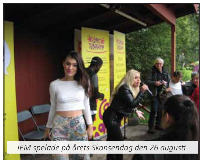
JEM spelade på årets Skansendag den 26 augusti