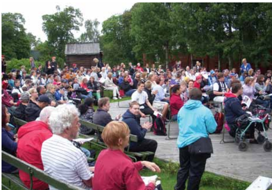
I väntan på allsången på FUB's Skansen-dag 2012

För mer information och anmälan till höstens möten, se under fliken "Medlemsinformation" på vår hemsida eller kontakta kansliet. Föranmälan krävs till samtliga möten.