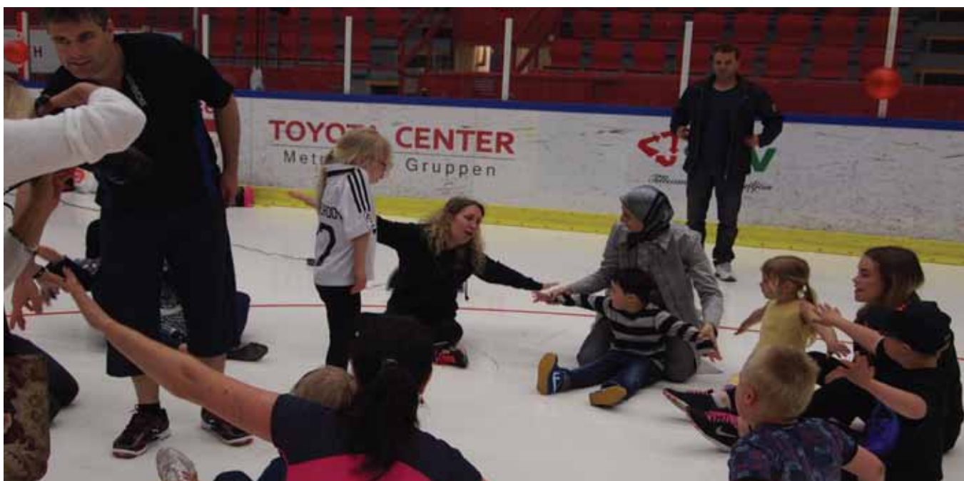
Barngymnastik-gruppen har ett prova-på pass på mässan "Min Fritid".

För info om aktiviteterna, anmälan och kontakt med ledare - se vidare i fickbroschyren eller på vår hemsida, www.fubstockholm.se