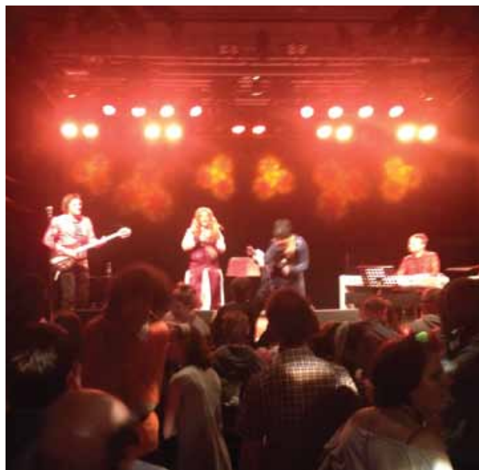
"ABBA" uppträder på FUB-discot på Fryshuset

Under 2013 fokuserar vi på boendesituationen för vår målgrupp i Stockholms stad. Vi kommer att lyfta frågor som hur vi kan få fler LSS-boenden, hur vi får bort hyror för gemensamhetsutrymmen och hur ett bra boende ska se ut. Bland annat ska vi besöka ett antal boenden för att höra hur boende och personal tycker att ett bra boende bör vara.