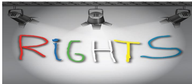
EU vill öka medvetenheten om rättigheter för personer med utvecklingsstörning

Vi medverkar även i ett spännande EU-projekt om rättigheter för personer med utvecklingsstörning, kallat "Lights on Rights!", och vi kommer att göra resor till Spanien, Polen och Ungern under 2016.