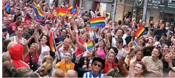
Kom med oss i Stockholm Pridefestivalens parad lördag 30 juli!

Nytt för i år är att vi deltar i Pridefestivalens parad den 30 juli, där vi hoppas på en stor uppslutning av alla medlemmar. Vi ska också arrangera en dansbandsvecka under sommaren i form av ett läger på en folkhögskola i Stockholmstrakten.