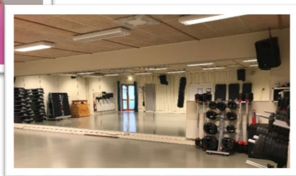
Här tränar vi